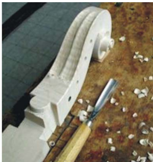
چلو از گوارنری a Guarneri Cello

کوچکترین ساز قابل ارائه یک شانزدهم است که برای نواختن کودکان دو ساله طراحی شده است. سازهای کوچک یک شانزدهم برای اجرای متد ژاپونی سوزوکی و شینوزوکی در نظر گرفته می شوند. سازهایی نیز کوچکتر از یک شانزدهم ساخته می شوند که برای بچه های زیر دو سال مفید به نظر می رسند.