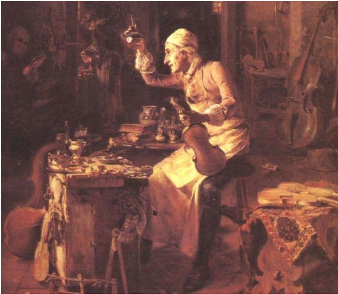
استرادیواری در کارگاهش Stradivari in his workshop

او در تمام دوران طولانی زندگی اش با دقت، عشق و علاقه ای وافر به ساز و موسیقی، کارگاهش را ترک نگفت و بر روی بسیاری از آخرین کارهایش با غرور و احترام و سرافرازی و خضوع، تاریخ ساخت ساز را نوشت. در یکی از این سازها به نام Rode ساخته شده در سال ۱۷۳۳ در قسمت برجستگی دسته آن آمده است: محصول ۸۹ سالگی.