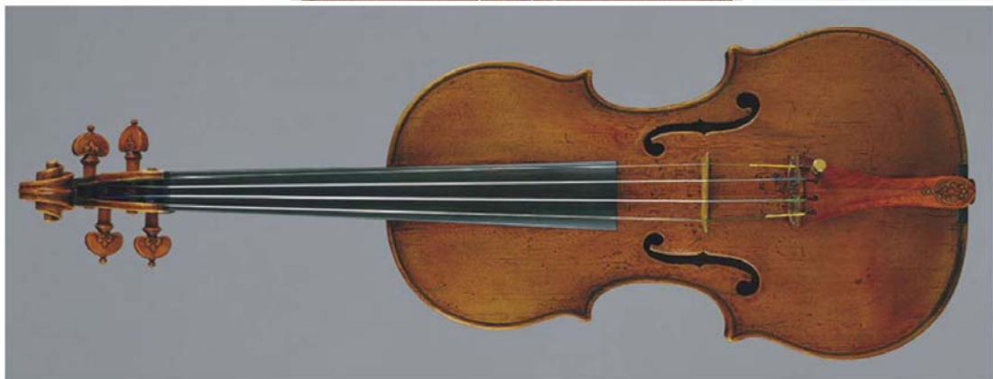
کلکسیون از آماتی an Amati collection