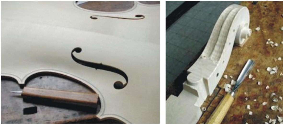
چلو از گوارنری a Guarneri Cello

صدای بسیار زیبا و شفاف آن‌ها که در پاره‌ای از ریزه‌کاری‌های دیگر نیز مکتوم است. دینامیسم عالی، وسیع و بهترین ارائه در محدوده‌های مختلف صدادهی ویلن، صافی و درخشندگی فوق تصور و بالانس صدادهی حساب شده، از ارزش‌های دیگر این ویلن‌ها، ذکر می‌شود. ویلن‌های کرمونایی ایتالیا، در گذر سال‌های طولانی برای نبوغ آماتی‌ها، برای رنسانس ایتالیا و برای همه سازندگان سازهای مختلف از ابتدا تا کنون، احترام و تکریم به ارمغان آورده‌اند. امروزه نیز سازندگان پر قدرتی در جهان دست به کار ساختن ویلن‌های ارزشمندی هستند که یکی از ویلن‌های کرمونا را به عنوان مدل خود بر می‌گزینند. در حال حاضر سازهایی در اندازه‌های مختلف حتی برای