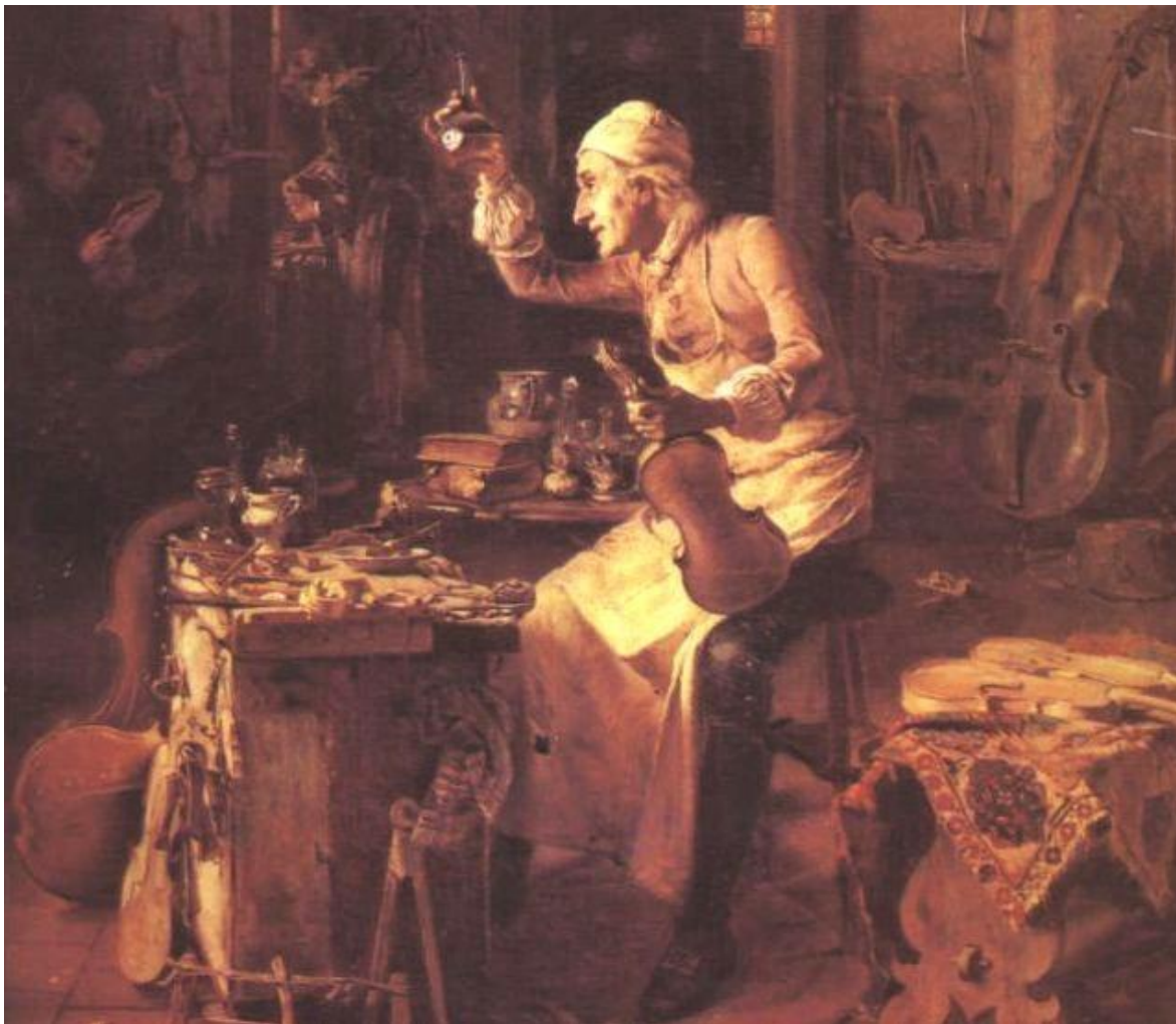
استرادیواری در کارگاهش Stradivari in his workshop

او در تمام دوران طولانی زندگی‌اش، با دقت، عشق و علاقه‌ای وافر به ساز و موسیقی، کارگاهش را ترک نگفت و بر روی بسیاری از آخرین کارهایش، با غرور و احترام و سرافرازی و خضوع، تاریخ ساخت ساز را نوشت. در یکی از این سازها، به نام رُد ۲۰ ساخته شده در سال ۱۷۳۳ در قسمت برجستگی دسته آن آمده است: محصول ۸۹ سالگی.