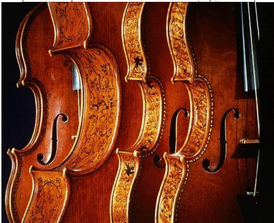
ویلن‌های استرادیواری Stradivari violins