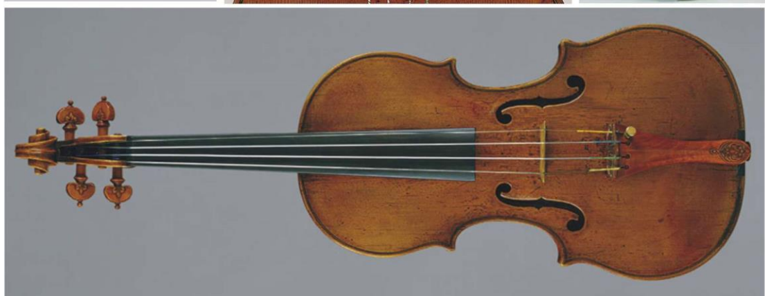
کلکسیون از آماتی an Amati collection

امروزه هنرمندان بزرگ، ویلنیست‌های برجسته و ویرتوئزهای نابغه، پس از گذشت دو بیست سال هنوز هم در جستجوی سازهای طلایی کرمونا هستند. شایستگی و لیاقت این ویلن‌های جاودانی نه تنها در